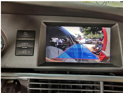
Pohled zadní kamery