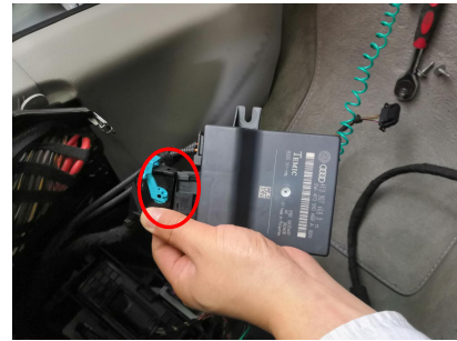
Konektor napájení parkovacích čidel