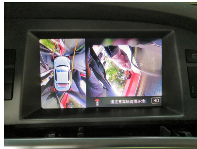
Vodící parkovací linky