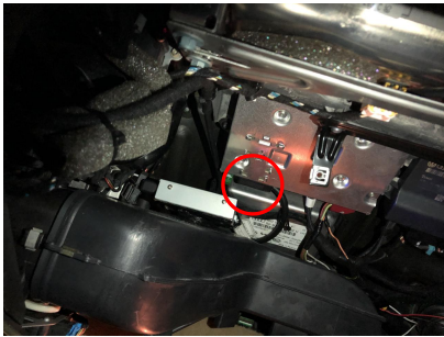
Hlavní jednotka v A8 a připojení LVDS