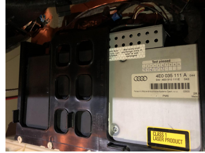
Vyjměte hlavní jednotku